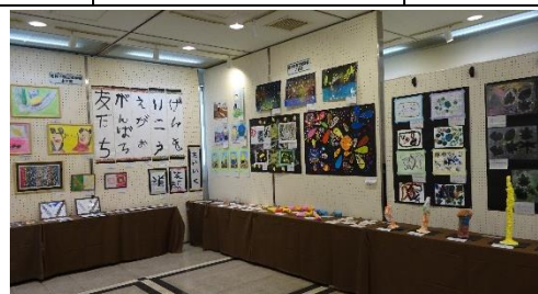
昨年の作品展の様子