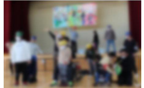
ダンス『モーニングサン』