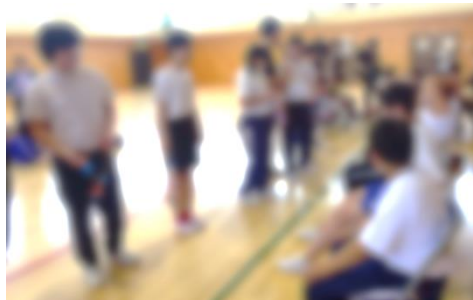
レイのプレゼント