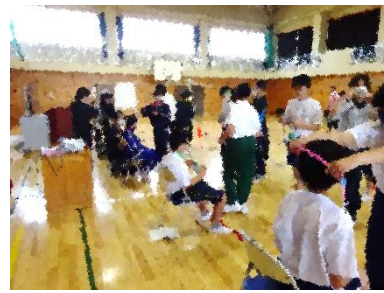
レイのプレゼント