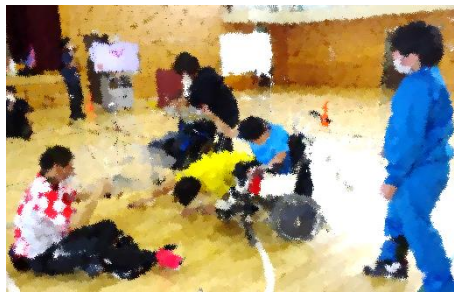
クラス対抗！新聞玉入れバトル！